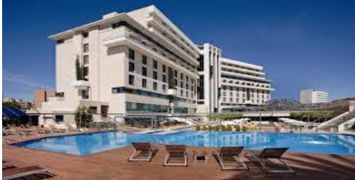
HOTEL NELVA 4* Av. Primero de Mayo, 5

Hab. doble uso Ind. 94,00 € Hab. doble 108,00 €