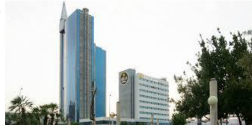
HOTEL AGALIA 4* Av. del Rocío, 2

Hab. doble uso Ind. 89,00 € Hab. doble 99,00 €