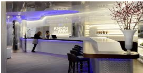
HOTEL TRYP RINCON DE PEPE 4* C/. Apóstoles, 34

Hab. doble uso Ind. 108,00 € Hab. doble 125,00 €