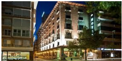
HOTEL CATALONIA CONDE FLORIDABLANCA 4* C/. Princesa, 18

Hab. doble uso Ind. 95,00 € Hab. doble 115,00 €