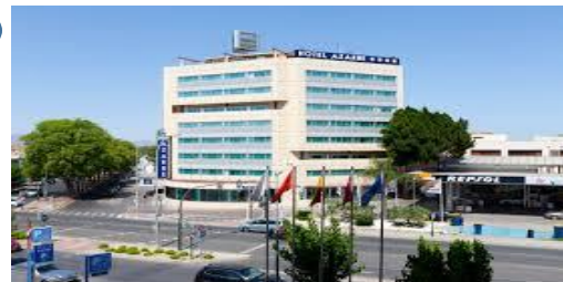
HOTEL AZARBE 4* Av. Arquitecto Miguel A. Beloqui, 7

Hab. doble uso Ind. 89,00 € Hab. doble 99,00 €