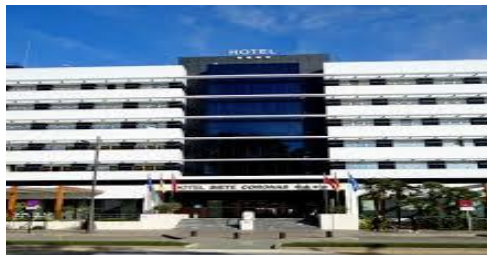
HOTEL MURCIA SIETE CORONAS 4* Paseo Garay, 5

Hab. doble uso Ind. 110,00 € Hab. doble 120,00 €