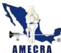
Asociación Mexicana de Cirugía Reconstructiva Articular y Artroscopia (AMECRA)